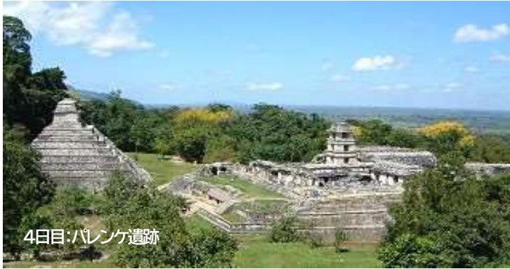
4日目：パレンケ遺跡