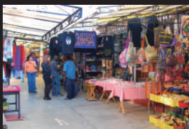
▲ ルチャ旅の記念も忘れずに