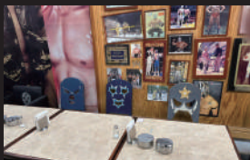
▲ ルチャドール経営のレストランではお宝写真が見れるかも？