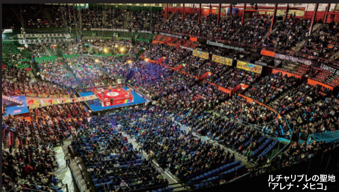
ルチャリブレの聖地「アレナ・メヒコ」

ルチャリブレの聖地「アレナ・メヒコ」で年に一度のビッグマッチ「CMLL アニベルサリオ」を観戦！他の日にもメキシコシティ、プエブラで興行がある限り観戦を約束します！