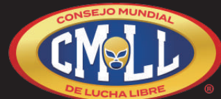
▲ CMLL の協力がなくては実現しない試合前のバックヤード見学！

◀ 昨年 (2023 年) の「アニベルサリオ」のフライヤー。今年の対戦カードの発表からも目が離せない！