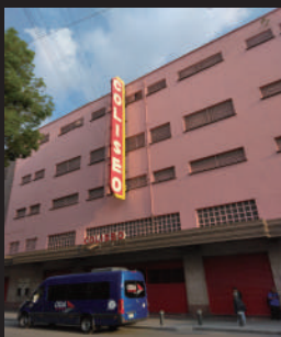
▲ メキシコシティなら「アレナ・コリセオ」も外せない