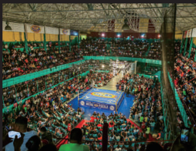
▲ ローカル感のある「アレナ・プエブラ」も！