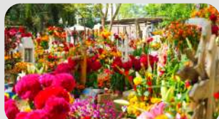
サン・アントニーノのお墓はお花でいっぱい!