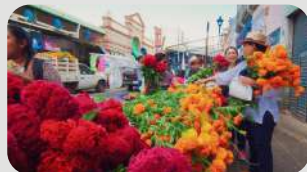
笑顔で迎えるのがメキシコの死者の日!