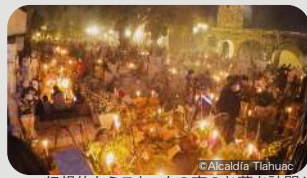
幻想的なミスキックの夜のお墓を訪問!